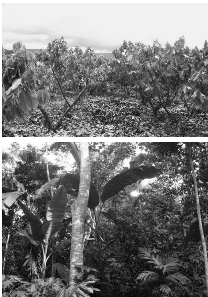
Figura 2: El monocultivo del cacao y el sistema agroforestal sucesional ([73])